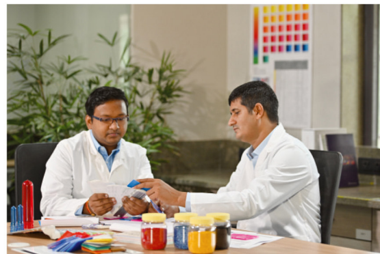
Услуги по подбору цвета

Coroplast известен тем, что обеспечивает исключительное качество, постоянство от партии к партии, и это достигается благодаря специальным современным лабораториям качества и анализа.