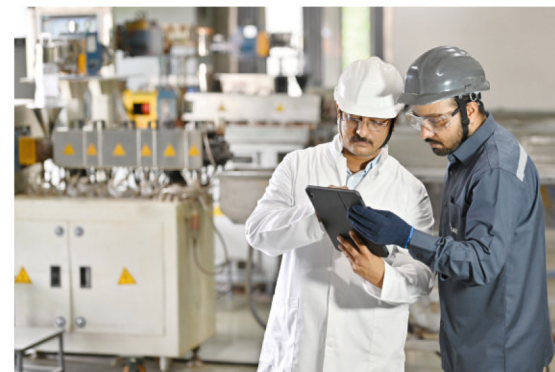
Сервис моделирования приложений